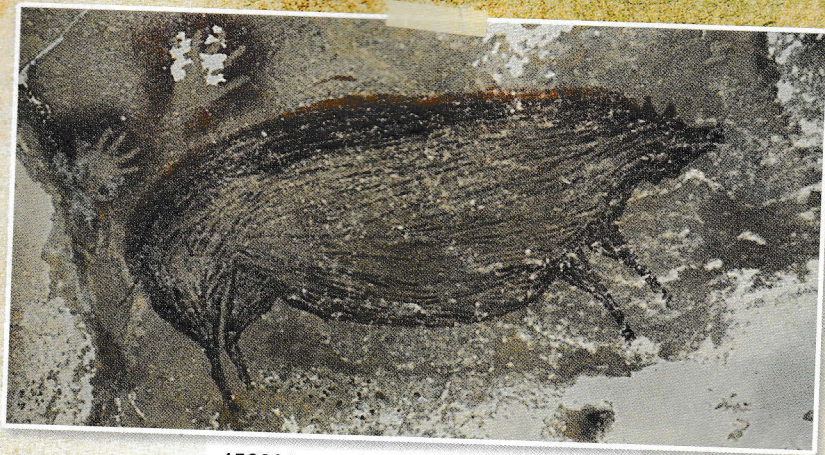
45000 let stara figura svinje bradavičarke

Štiri leta raziskav so bila potrebna, da so lahko z gotovostjo potrdili čas nastanka risbe in jo uvrstili v obdobje okoli 45.000 let pred Kristusom. Ta ugotovitev je sprožila svetovno senzacijo. Gre za najstarejšo doslej odkrito upodobitev živali (ali figure) v prazgodovini. Risba je približno dvakrat starejša od znamenitih podob iz francoskega Lascauxa ali španske Altamire.