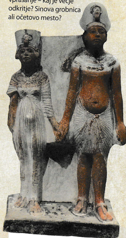
Kipec Nefreteti in Ehnatona iz leta 1346 pred našim štetjem

so ga iskale skozi minulo stoletje in zdaj smo ga končno našli. Ko se sprehodiš skozi dobro ohranjene ulice, imaš občutek, da se bo faraon z valovitimi črnimi lasmi pojavil izza vogala. Ta občutek je neopisljiv. Ostaja le vprašanje – kaj je večje odkritje? Sinova grobnica ali očetovo mesto?