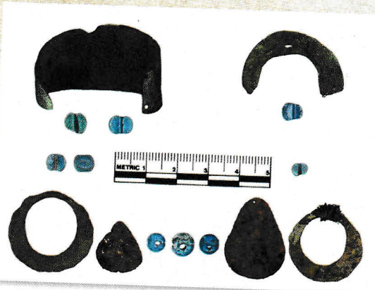
Nakit in steklene kroglice iz muranskega stekla, najdene na Aljaski

Dejstva so znana – Vikingi so bili prvi na vzhodnih obalah Amerike, Kolumb je prišel konec 15. stoletja, torej 500 let za njimi. Zgodovina je prvenstvo pripisala njemu. Vikingi bodo verjetno vedno prvi Evropejci v Ameriki, toda – leto 2021 je krepko zamajalo kolumbovsko teorijo. V kraju Punyik Point na Aljaski so namreč našli okrasne predmete oziroma modre steklene kroglice, ki izvirajo z beneškega otoka Murano. Ogljikovo datiranje je njihovo starost postavilo na začetek 15. stoletja, torej v čas približno 70 let pred Kolumbovim letom 1492.