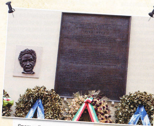
Spomenik Aldu Moru v Rimu

V vojni med krščanskim Zahodom in muslimanskimi skrajneži pa je lahko zmagovalec samo nekdo tretji – in ta tretji že čaka: to je Kitajska – največja onesnaževalka okolja in velika zatiralka človekovih pravic. To je scenarij, ki se ga moramo bati.