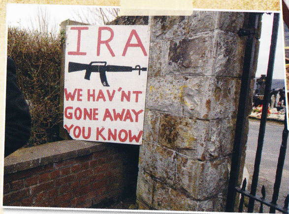
Znak Pro IRA zunaj mestnega pokopališča v Derryju na Severnem Irskem

Poglejmo še nekatere dogodke med letoma 1970 in 2000, s katerimi se je moderni terorizem rodil. Komunistične Rdeče brigade so ugrabile in po 55 dneh ujetništva usmrtille nekdanjega predsednika italijanske vlade Alda Mora. IRA – Irska republikanska armada, ki se uradno bori za odcepitev Severne Irske od Velike Britanije, je na čoln postavila bombo članu angleške kraljeve družine lordu Louisu Mountbattnu, pri čemer sta umrla tudi dva najstnika. PLO, organizacija za svobodo Palestjine, je ugrabila italijansko ladjo za križarjenje in ubila ameriškega turista v invalidskem vozičku.