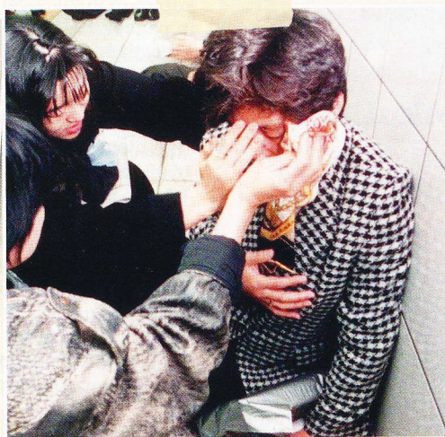
Po tem, ko so v tokijski podzemni železnici izpustili sarin