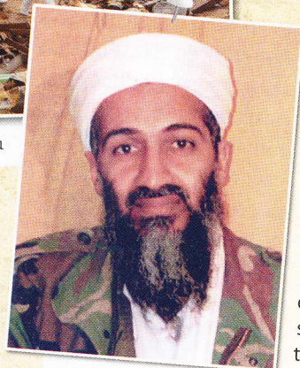
Osama bin Laden, voditelj Al Kaide

obrambno ministrstvo ZDA Pentagon, drugo je strmoglavilo pri spopadu potnikov z ugrabitelji,