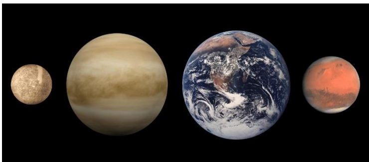
Notranji planeti (Wikipedija)