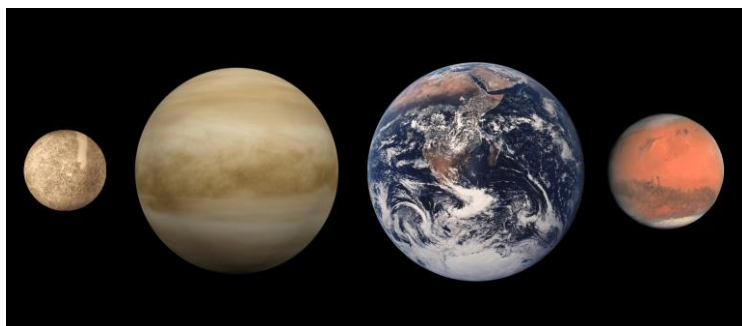
Notranji planeti