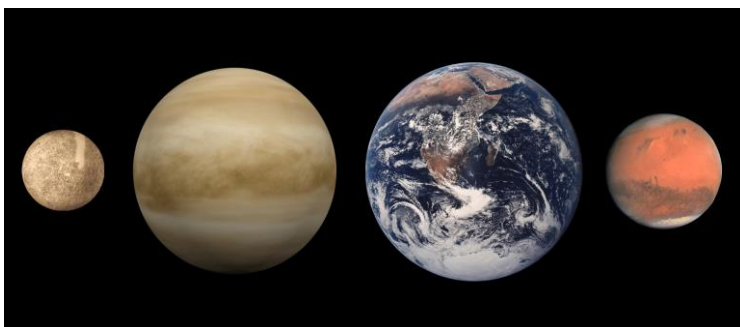
Notranji planeti (Wikipedija)